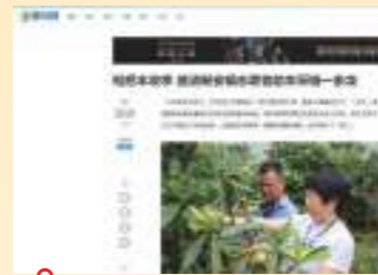
5.24 腾讯网 枇杷丰收季 德清新安镇志愿者 助农产销一条龙