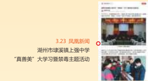
3.23 凤凰新闻 湖州市埭溪镇上强中学 “真善美”大学习暨禁毒主题活动