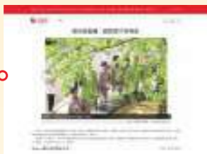
4.9 人民网 湖州洛舍镇：银杏树下学党史