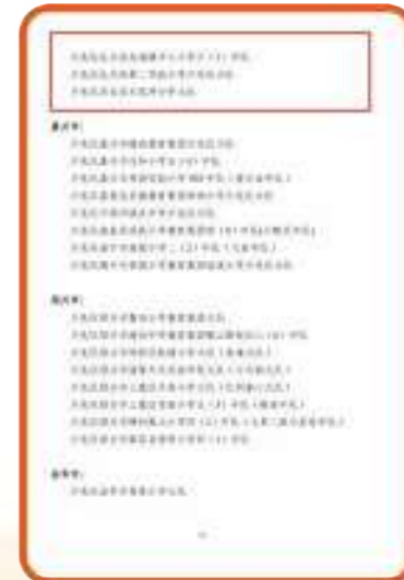
■ 2021年“浙江省成绩突出少先队集体”（8个）