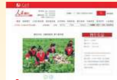
11.3 人民网 浙江长兴：志愿者助农 萝卜喜丰收