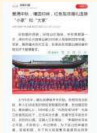
9.19 光明日报 爱满中秋，情圆顶峰， 红色集体婚礼连接“小家”和“大家”