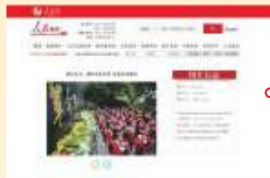
4.2 人民网 浙江湖州：祭英烈 寄哀思