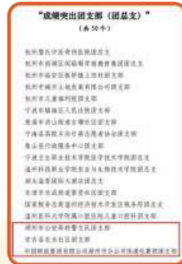
■ 2021年“浙江省成绩突出团委（团工委）2个 ■ 2021年“浙江省成绩突出团支部（团总支）3个