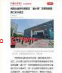
6.5 中国新闻网 构建公益诉讼新路径 “益小青”志愿观察团 浙江长兴成立