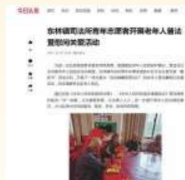
10.30 今日头条 东林镇司法所青年志愿者开展 老年人普法暨慰问关爱活动