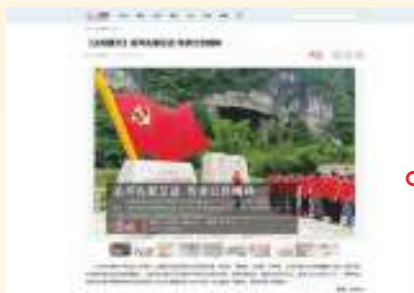
6.30 光明网 【光明图刊】追寻先辈足迹 传承红色精神