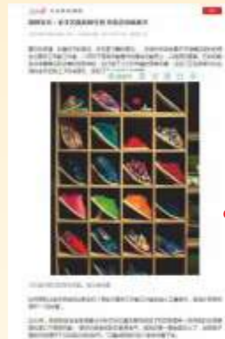
10.22 人民日报 湖州安吉：老手艺焕发新生机 布鞋迈向新春天