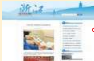
4.13 中国新闻网 浙江吴兴妙西：师徒结对薪火传 深入宣讲迎建党百年