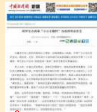
10.1 中新网 柯坪安吉两地 “小小石榴籽”为祖国母亲庆生