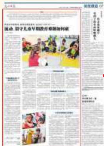
7.20 光明日报 流动、留守儿童早期教育 难题如何破