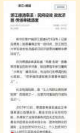
6.1 新华社 浙江德清阜溪：民间设奖 奖优济困 传递幸福温度