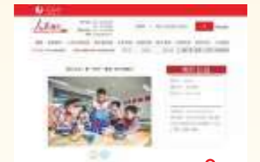
10.29 人民网 浙江长兴：做“雪车”模型 迎冬奥盛会