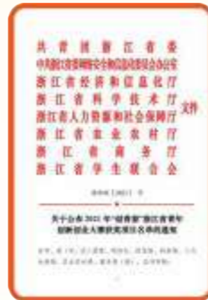
■ 2021年“创青春”浙江省青年创新创业大赛获得一银一铜银奖项目（51CLOUD-云平台）、铜奖项目（有机光电领域核心真空装备）