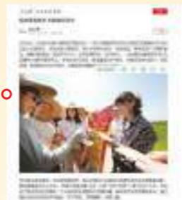
4.30 人民日报 绽放青春风采 礼赞建党百年