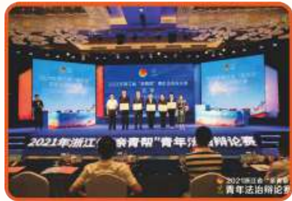
■ 2021年浙江省“亲青帮”青年法治辩论赛亚军