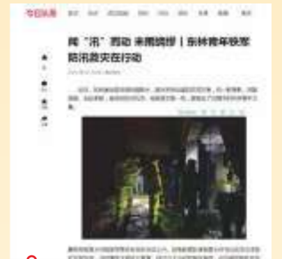
8.27 今日头条 闻“汛”而动 未雨绸缪 | 东林青年铁军 防汛救灾在行动