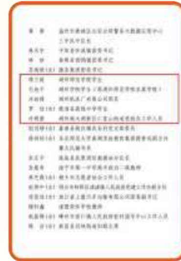
■ 2021年“浙江省成绩突出共青团员”5人 ■ 2021年“浙江省成绩突出共青团干部”3人