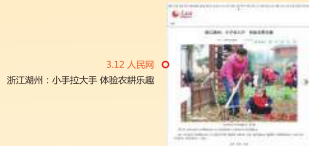
3.12 人民网 浙江湖州：小手拉大手 体验农耕乐趣